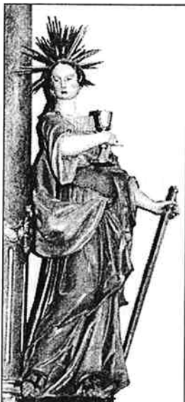
Fotó: Sólyom László

December 4.: Szent Borbála életének kiteljesedése, teljes odaadottságának emlékűnepe. Egy szent még nevenapján sem kapni, hanem adni vágyik: segíteni, lelkeket menteni. Egy ünnepelt, akit a hitéért, hitünkért vállalt meghurcoltatások dicsőítettek meg. Kehely, kard, korona: e hármas szimbólum a szent attribútuma, ezzel ábrázolják az újlaki templomban is. E hármas jelkép sűríti magába Borbála életének örömhírét: a kehely az örvedes (kereszttség), a kard a fájdalmas (vértanúság), a korona a dicsőséges (szentség) titkok hordozója. A Krisztusban való megszületést azonban hosszú 'advent', várakozás előzte meg. E várakozás szimbóluma a torony. A torony, ahol Borbálát gazdag, pogány apja bezárva tartotta. De a torony , a szülői tiltás, féltés eszköze a tisztánlátás, megszentelődés helyszínévé vált. A lány kisgyermekségétől fogva megvetette a bálványokat, és gondolatai