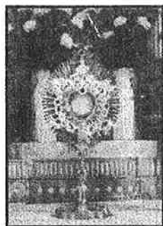
„Gyönyörködjél az Úrban, és megadja néked szíved kéréseit.” Zsolt 37,4