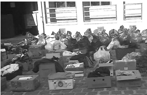
Ilyen volt a plébánia udvara munka közben...