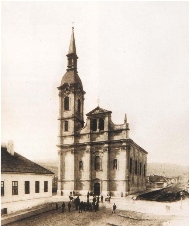
Az újlaki templom egykoron...