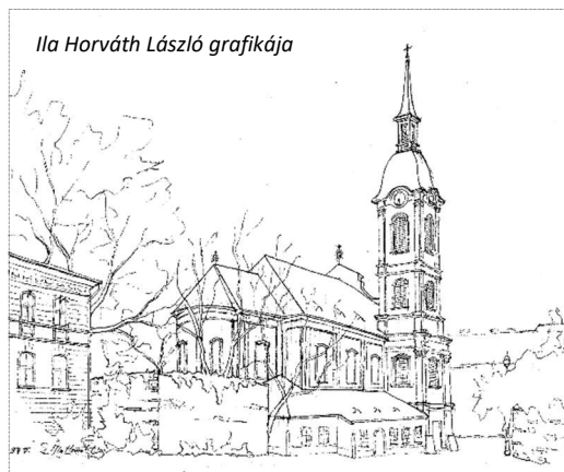
Ila Horváth László grafikája